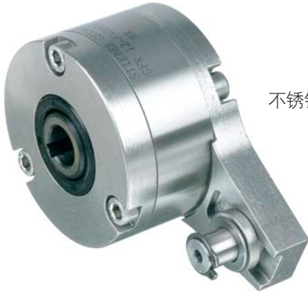
不锈钢分度离合器用于食品加工业。