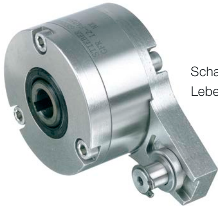
Schaltfreilauf aus rostfreiem Stahl für die Lebensmittelindustrie