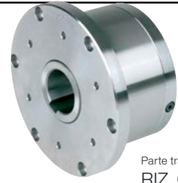
Parte trasera de RIZ..G1G2