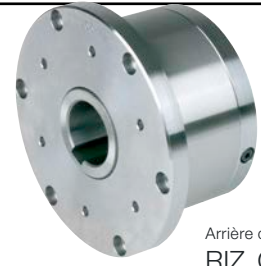
Arrière de RIZ..G1G2