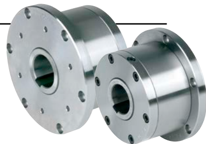
Задняя часть Муфты AL..F2D2