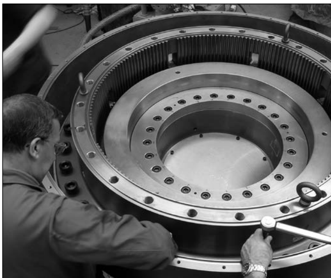
HBS 42 Bremsenbaugruppe

Ein Netz von serviceorientierten, technisch geschulten Wichita-Vertragshändlern wird Ihren Ersatzteilbedarf umgehend decken.