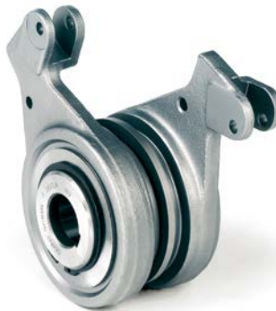
Kombinierter Schaltfreilauf und Rücklaufsperre in der Hochspannungstechnik