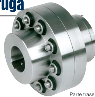
Parte trasera de RIZ..ELG2