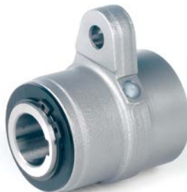
Embrague de indexado de alto rendimiento para su utilización en una máquina de impresión en offset