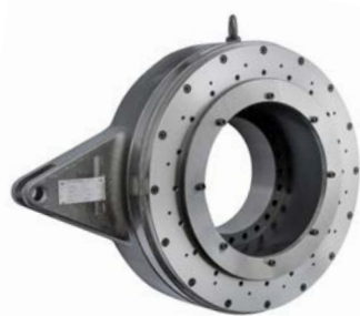
Limitador de torque como proteção contra sobrecarga em uma aplicação marítima