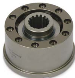
Embreagem de avanço para aplicações de acionamento múltiplo em máquinas de construção