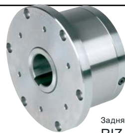
Задняя часть RIZ..G1G2